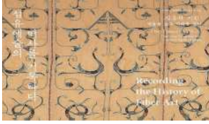
I. 섬유예술의 역사를 기록하다 온라인 전시