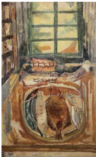
문신, 〈명태〉, 1958

2 paintings by Moon Shin from the MSM collection were exhibited in the 〈Encounter: The Modern Art Association 1957-1960〉 that was held at MMCA Cheongju.