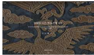
Google Arts & Culture 〈섬유의 시간: 한국 전통 자수〉