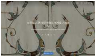
Google Arts & Culture 〈섬유의 시간: 섬유예술의 역사를 기록하다〉