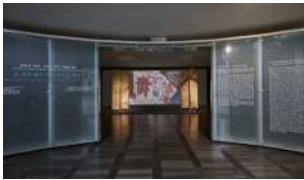
II. 섬유예술의 미의식을 잇다 VR 전시