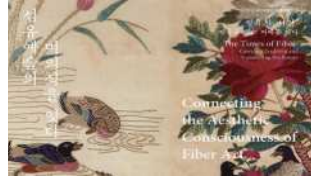
II. 섬유예술의 미의식을 잇다 온라인 전시