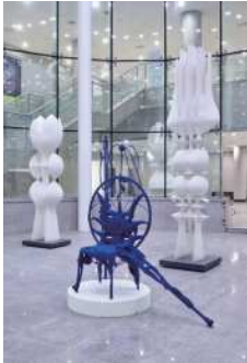
오화진, <장식요법-FC> 2019