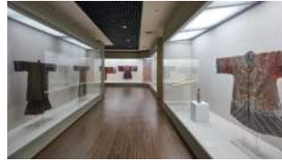
I. 섬유예술의 역사를 기록하다 VR 전시