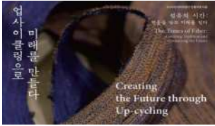
III. 업사이클링으로 미래를 만든다 온라인 전시