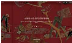
Google Arts & Culture 〈섬유의 시간: 한국 근현대 자수〉