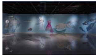
III. 업사이클링으로 미래를 만든다 VR 전시